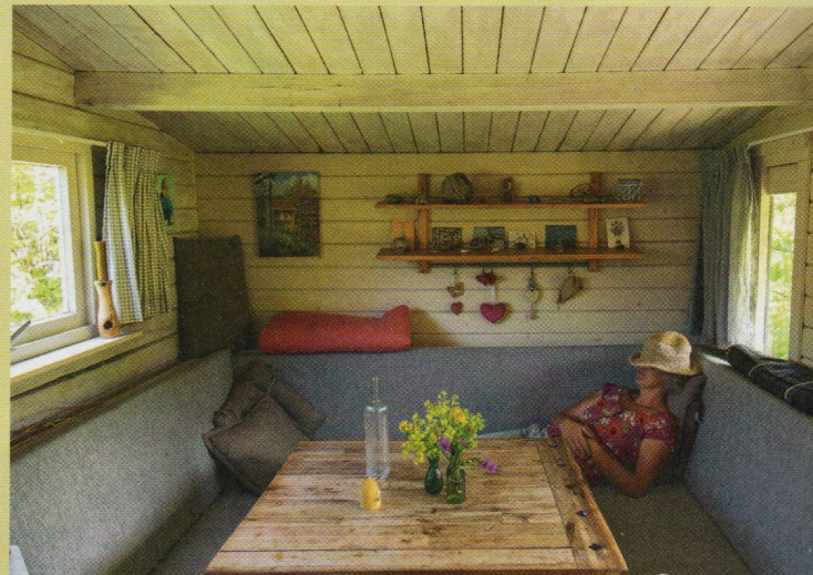
Rust na het werk.

van het gewas. Daarom gebruik ik het ook op bloesem; mijn appels smaken bij de oogst beter en zijn langer bewaarbaar. Ik maak ook een vegetarisch compostpreparaat. Dat doe ik niet-traditioneel. Bij het klassieke compostpreparaat worden vijf verschillende planten die verbonden zijn met de planeten, in dierlijke omhullingen gestopt en een zomer of een winter lang ingegraven of opgehangen. De astrale krachten van de dierlijke omhullingen zorgen dan voor de verbinding tussen hemel en aarde. Bij het vegetarisch preparaat maak ik die verbinding zelf door de planten te vijzelen terwijl ik me afstem op de planetenkrachten. Een drupje honing wordt toegevoegd voor het dierlijke element.”