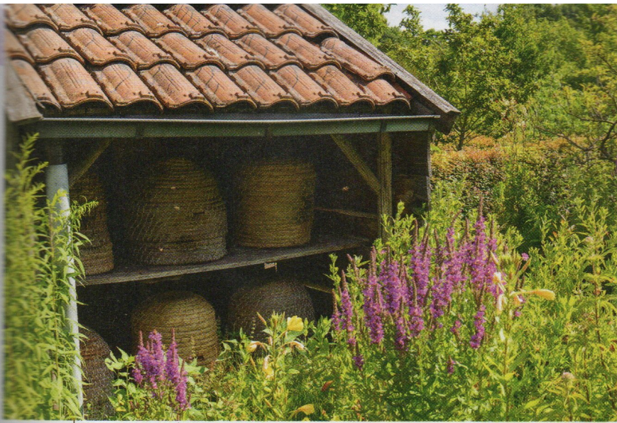
De bijenstal met daarin zes korven: in een dynamische tuin horen dieren.

“Je ziet overal bloemen, maar niets is aangeplant, of door mij bepaald waar het komt te staan, alle bloemen zijn wilde onkruid uit zichzelf gekomen, of door de vogels of muizen gebracht.”