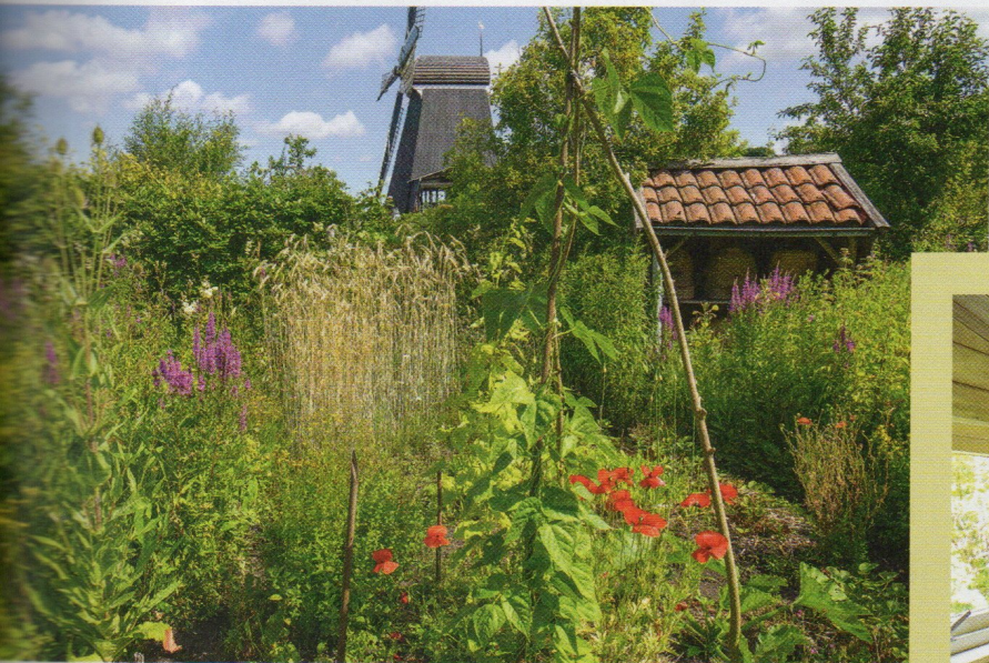
Vanaf de tuin is er zicht op een oude houtzaagmolen.